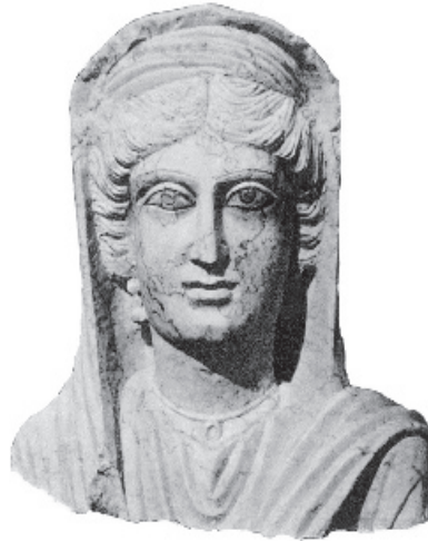
9. Portret możnej Palmyrenki z pomnika nagrobnego, połowa III w.

przetrwania owych kultów semickich do epoki późnego cesarstwa, co odnosi się również do arabskich bóstw czczonych w mieście. Potwierdza to notoryczną prawdę, że właśnie w sferze wierzeń oraz związanej z nimi sztuce sakralnej autochtoniczne elementy kulturowe najdłużej się opierały procesom hellenizacji i romanizacji. Na II w. przypada wzniesienie sanktuarium innego bóstwa, cieszącego się w Palmyrze popularnością – Baalszamina. Ze świeckich zabytków klasycznej sztuki wymienić należy palmyreńską agorę, monumentalną magistralę, przecinającą miasto ze wschodu na zachód, ozdobioną blisko 400 kolumnami o wysokości