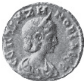
10. Zenobia, tetrachma aleksandryjska, awers

niez Ammianus Marcellinus (XXVIII 4, 9): z babilońską Semiramidą, egipską Kleopatram (z nią szczególnie się porównywała), z karyjską władczynią Artemizją.