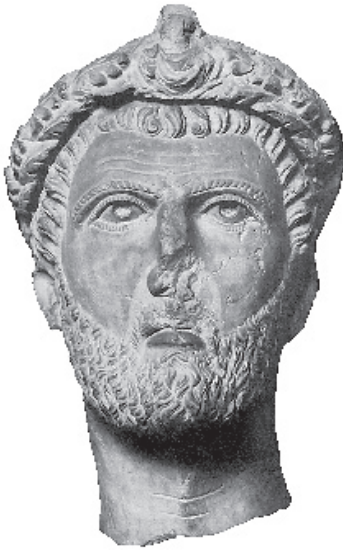
8. Portret mężczyzny, wapień, III w. Palmyra

fą z Palmyry”, a będący ustawą podatkową, która dostosowała dawne zasady opodatkowania towarów do nowych zarządzeń cesarza Hadriana 4 . Odpowiednią uchwałę ogłosiła w 137 r. rada miejska, ustanawiając nowe opłaty pobierane od poszczególnych artykułów w imporcie i eksporcie oraz w ich sprzedaży na terenie „wolnego” miasta 5 .