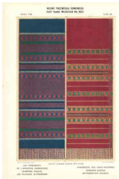
2. Chromolitografia na podstawie rysunku Stanisławy Pawulskiej.