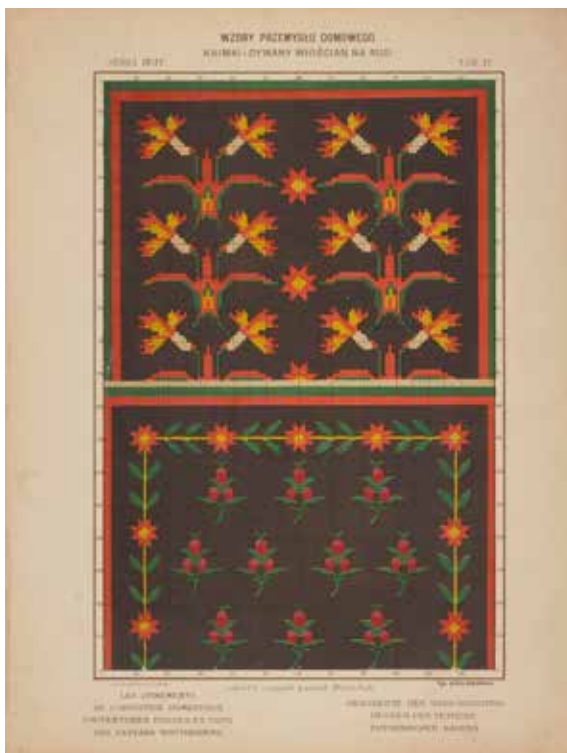
1. Chromolitografia na podstawie rysunku Heleny Komorowskiej.