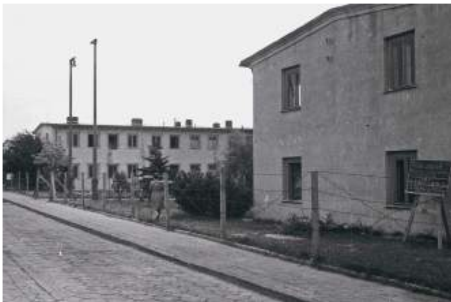
18. Przed każdym blokiem ustawiono wolnostojącą tablicę szkolną. Zapisywano na nich codzienne raporty oraz prośby i życzenia pensjonariuszy. W prawym dolnym rogu fotografii widoczna jest taka tablica, ustawiona przed Blokiem 1: „Radio zepsute!!! Prosimy o szachy, warcaby, karty do kanasta”. Podano również stan pensjonariuszy przebywających na kwarantannie: mężczyzn – 11, kobiet – 41, personel – 7, razem: 59, dzieci – 16, n[iemowlę] – 1, razem dzieci 17, ogółem 76.