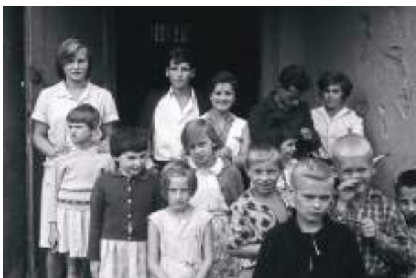
24. Wychowankowie i wychowawcy Domu Dziecka przy ul. Kieleckiej we Wrocławiu.