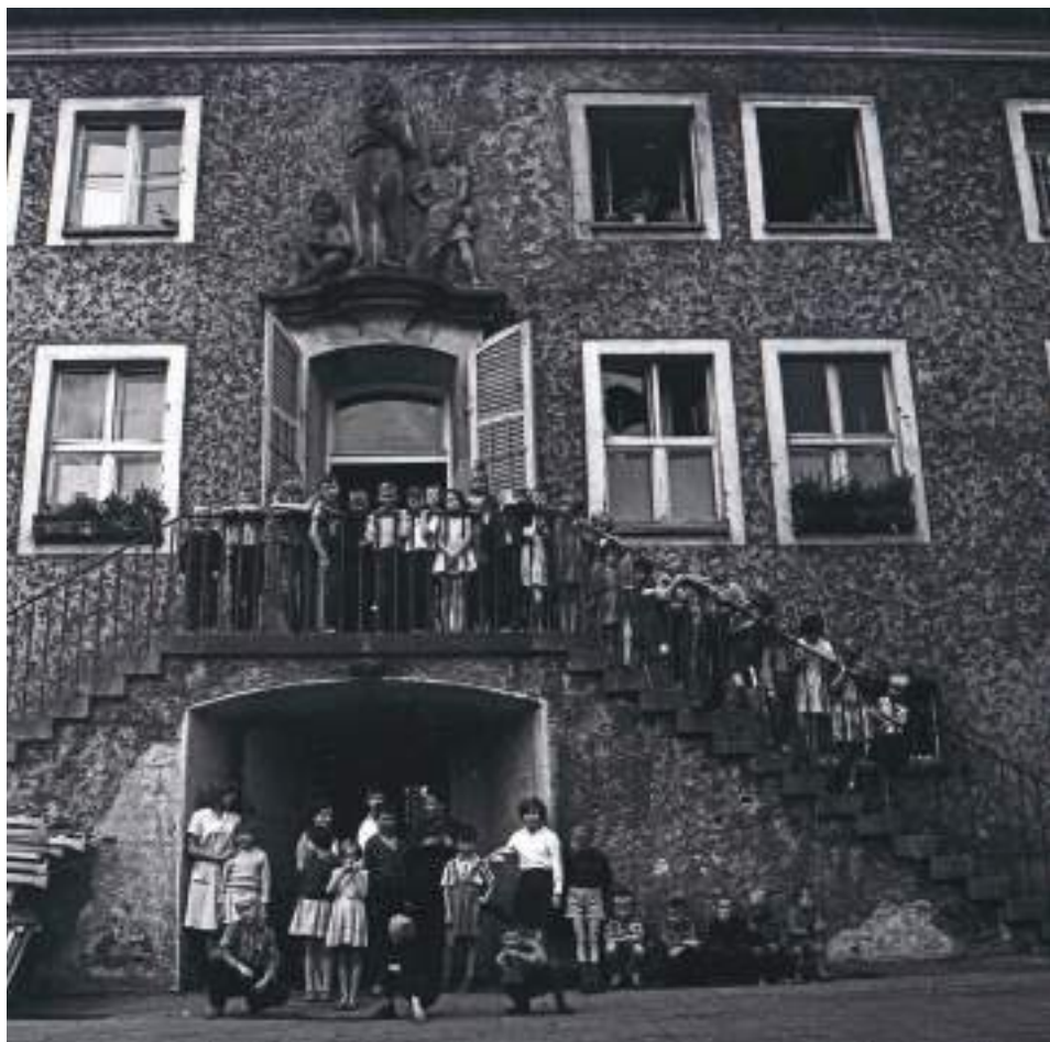
23. Wychowankowie i ich opiekunowie przed frontem Domu Dziecka przy ul. Kieleckiej na wrocławskich Złotnikach.