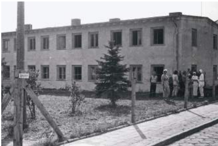
17. Pawilony z przyległymi do nich terenami zielonymi ogrodzono drutem kolczastym, tworząc tzw. bloki. Z lewej strony, na słupie od ogrodzenia, przybito tabliczkę: „IZOLATORY”.