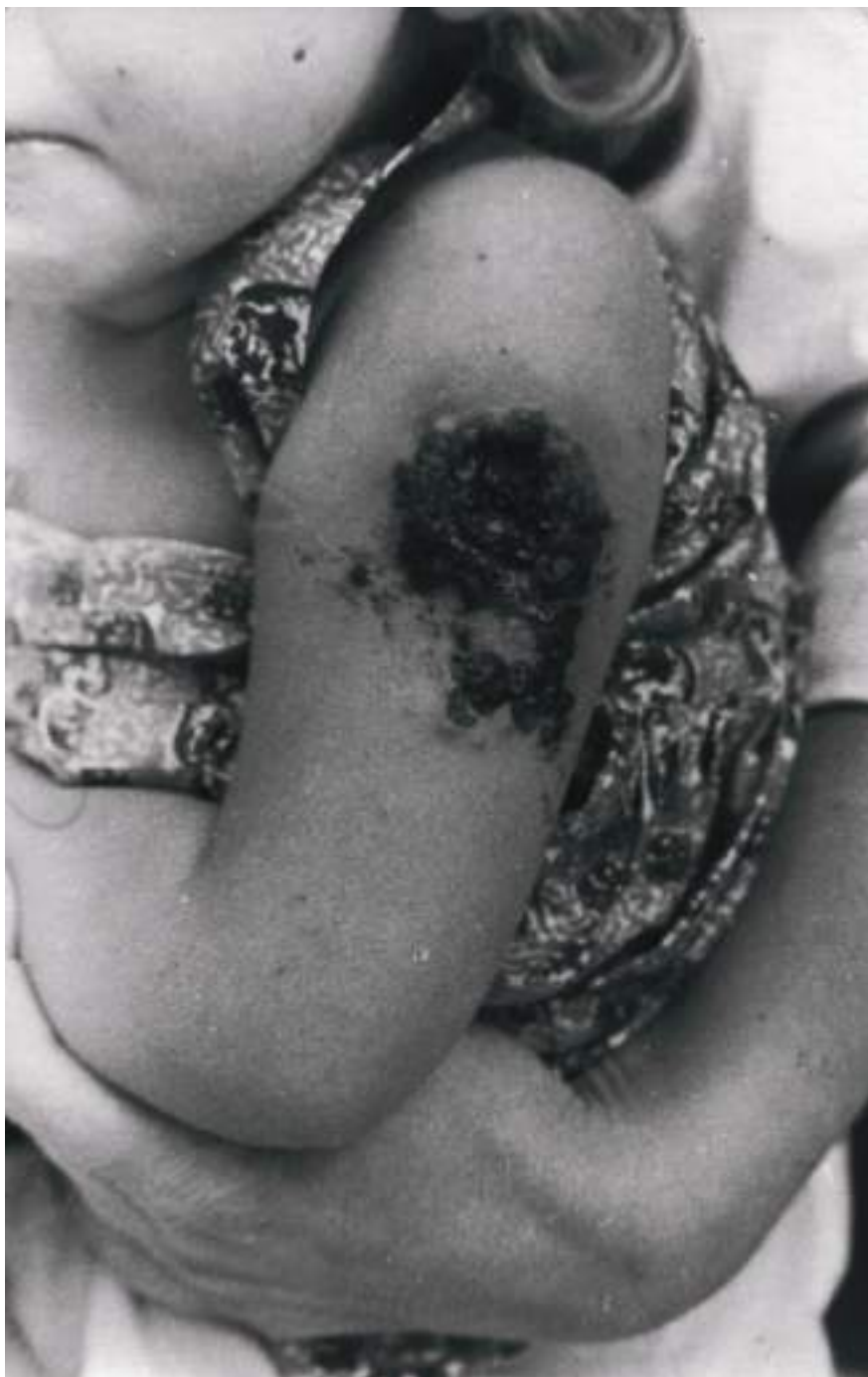
8. Najmłodszy pacjent chorujący na ospę prawdziwą. Na rewersie fotografii znajduje się nazwisko dziecka, napisane ołówkiem przez samego Józefa Bakalarskiego. W tym przypadku mamy najprawdopodobniej do czynienia z tzw. odczynem poszczeniowym.