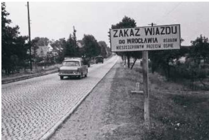
9. Tablice ostrzegawcze o zakazie wjazdu osób nieszczepionych umieszczane na drogach prowadzących do Wrocławia.