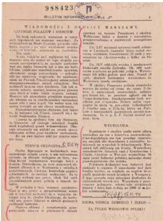
14. „Biuletyn Informacyjny”, wyd. „P” 1944, nr 24. Sygn. 988.423.