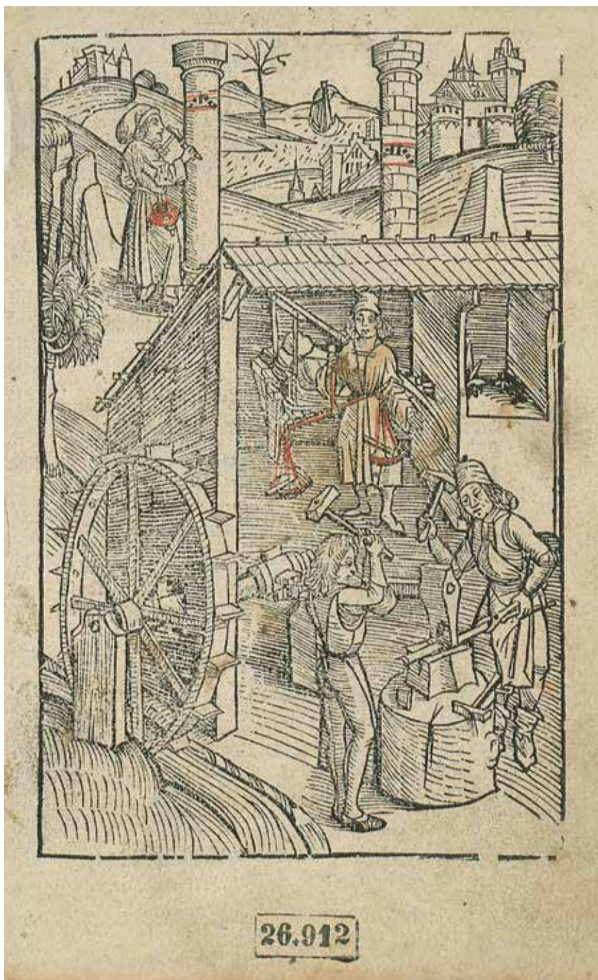
1. Pierwsza karta z drzeworytem w Flores musicae / Hugo Reutlingensis . [Strassburg: Johann Prüss, ca 1492?], XV.462.