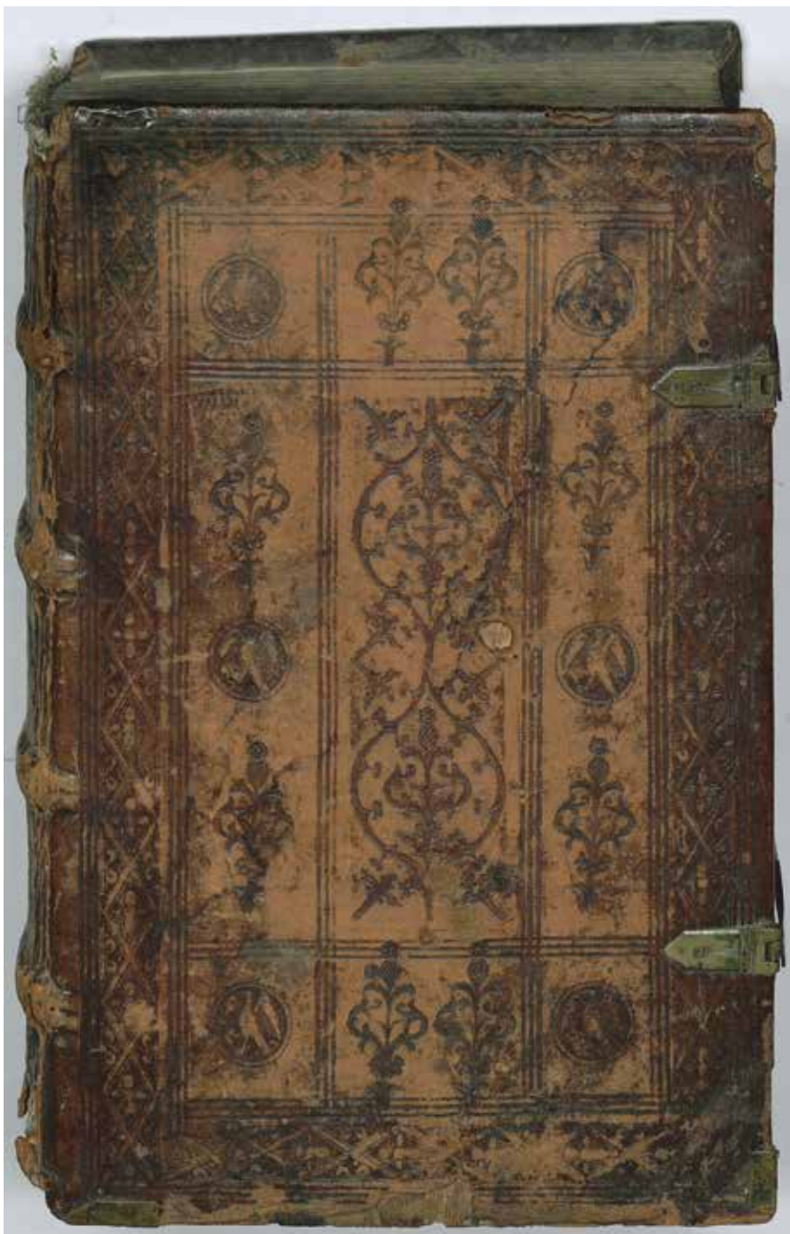
4. Oprawa gotycka dzieła Opera cum commentis Honorati Servii Mauri, Christophori Landini, Antonii Mancinelli, Aelii Donati et Domitii Calderini / Publius Vergilius Maro . Venezia: Philippus Pincius, 5 II 1499/1500, XV.545.