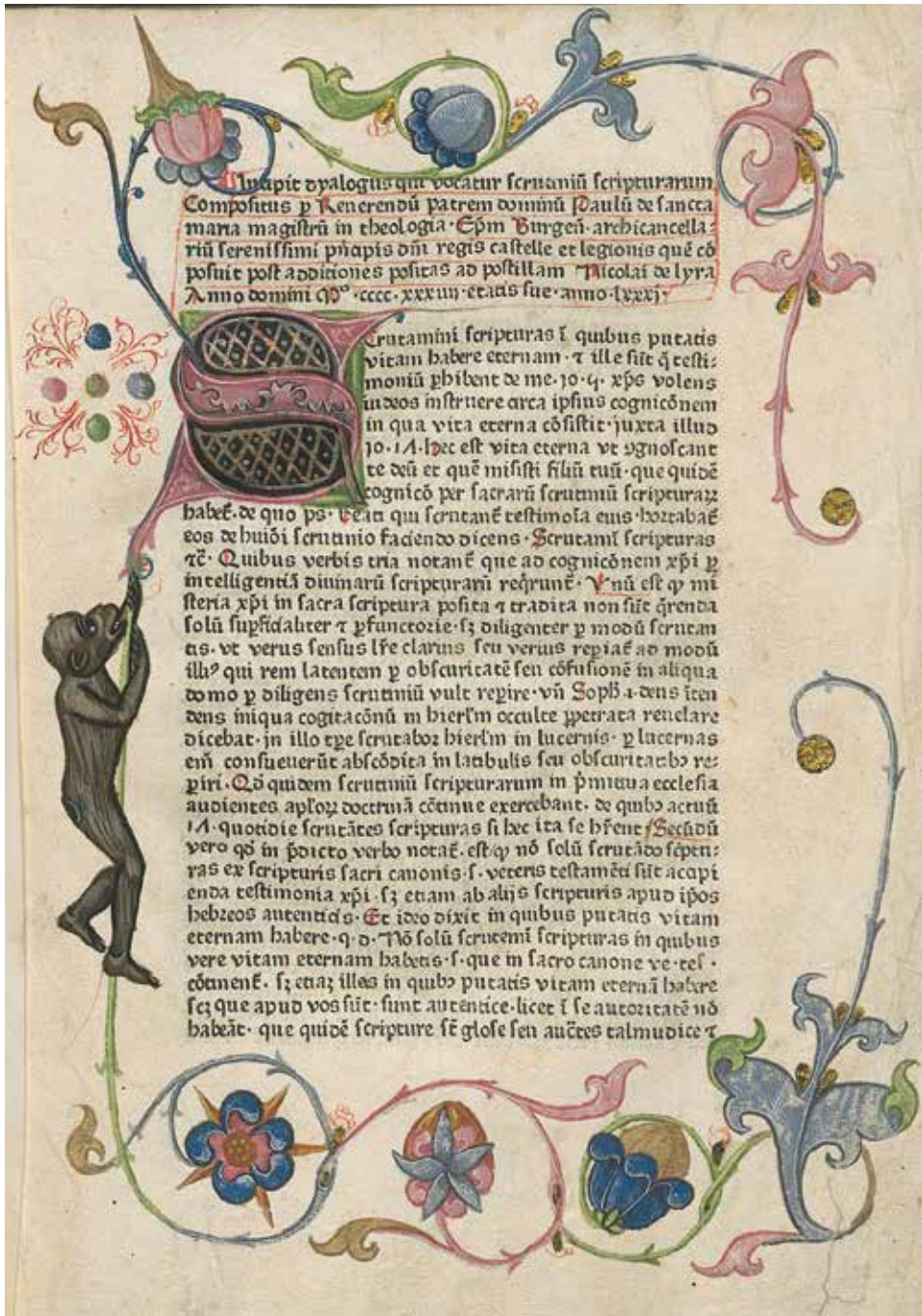
3. Floratura ze zloceniami i przedstawieniu małpy w Scrutinium scripturarum / Paulus de Sancta Maria. [Strasburg: Ioannes Mentelin, ca 1474], XV.459.