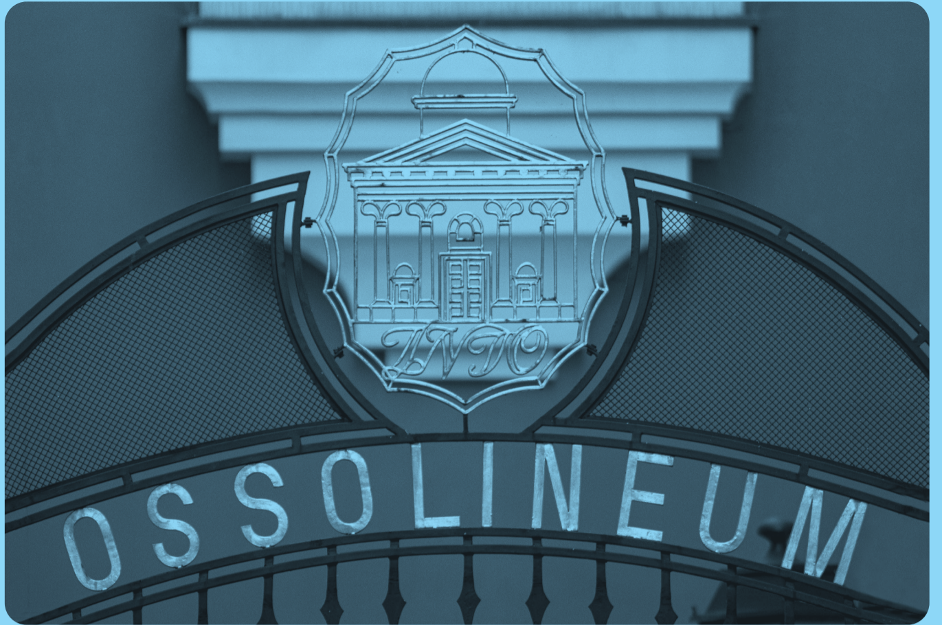
▲ Zakład Narodowy im. Ossolińskich fot. Mirosław Koch