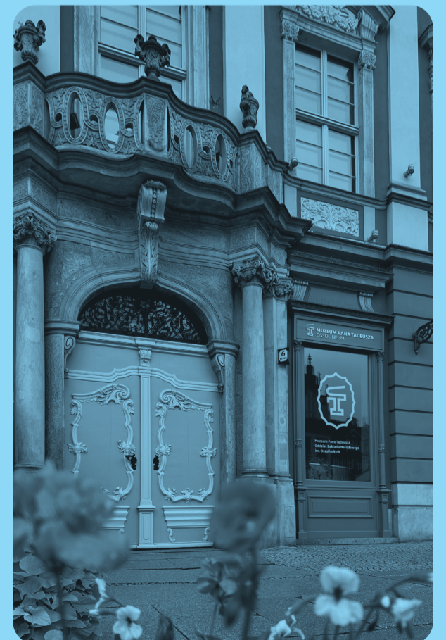
▲ Muzeum Pana Tadeusza

● Daniel Defoe, Robinson Crusoe , oprac. Jakub Lipski ● Muriel Rukeyser, U.S. 1 , tłum. Marta Koronkiewicz ● Zmienny krajobraz. 200 lat Muzeum Książąt Lubomirskich , red. Wojciech Gruk ● „Czasopismo Zakładu Narodowego im. Ossolińskich” t. 34.