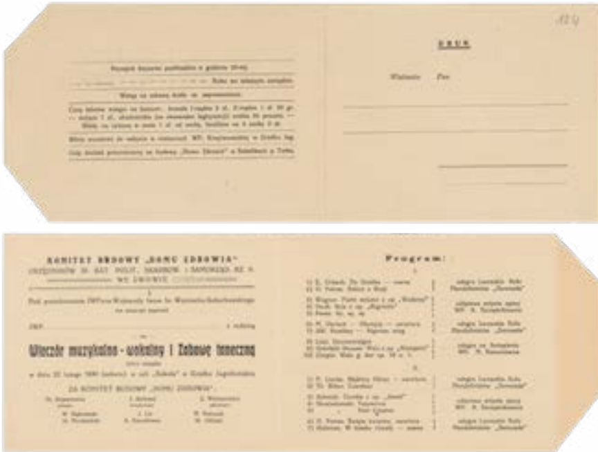
12. Zaproszenie na koncert „Serenady”, 22 lutego 1930.