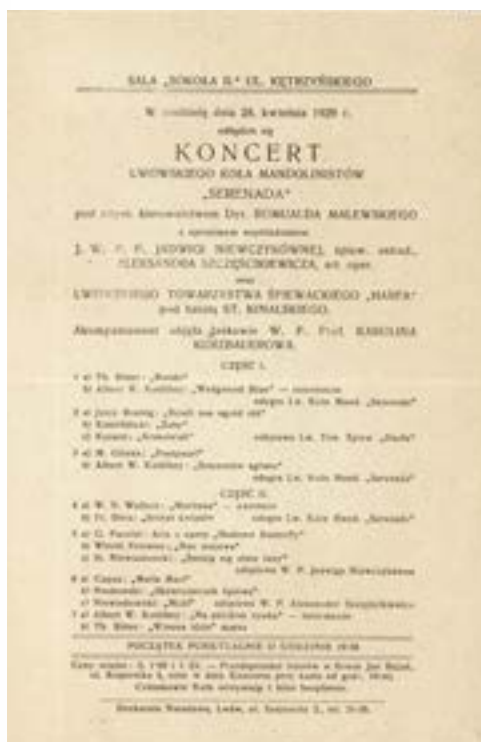
10. Program koncertu „Serenady”, 28 kwietnia 1929.