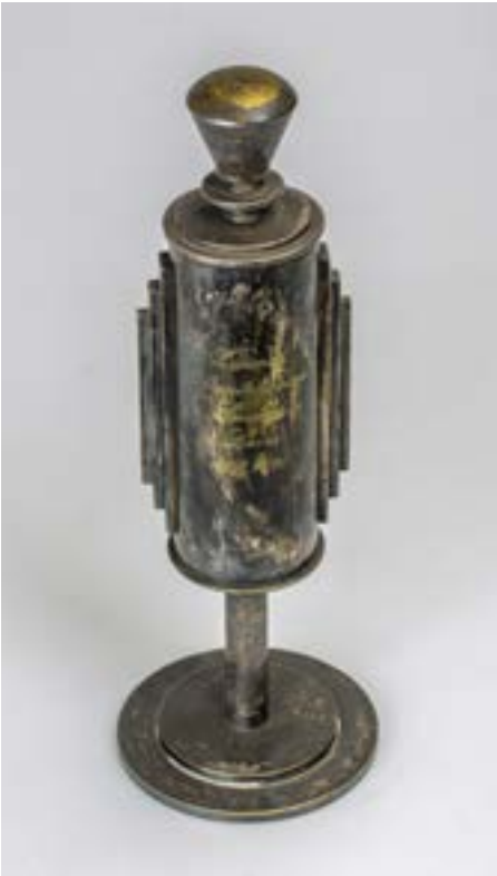
7. Pamiątkowy puchar w stylu art déco przyznany Aleksandrowi Szczęścikiewiczowi, 10 listopada 1928.