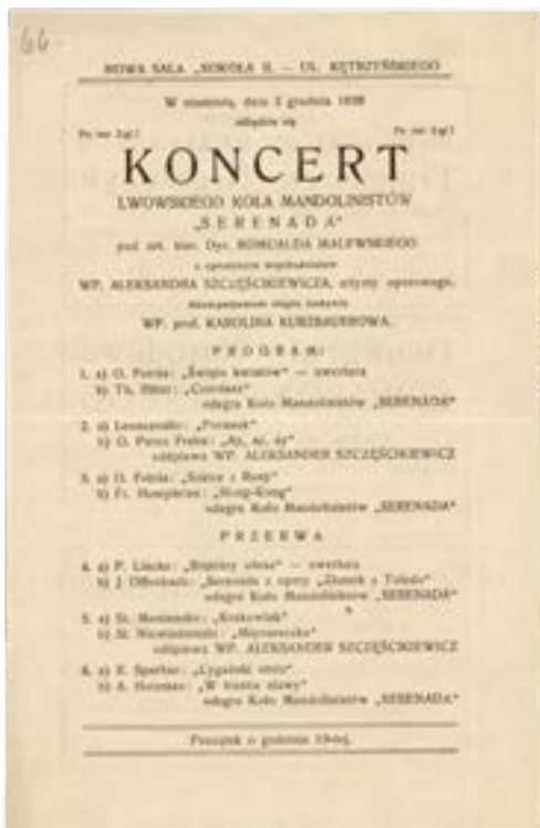
9. Program koncertu „Serenady”, 2 grudnia 1928.